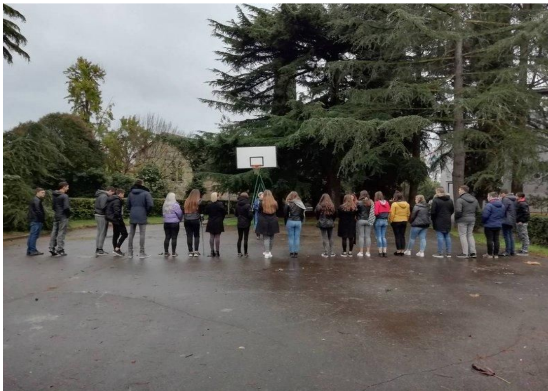
Fotografija 10. Provedba informativno-motivacijskih radionica o volontiranju, Poreč, 26.11.2018.

U suvoditeljstvu sa školskom koordinatoricom volontiranja Turističko-ugostiteljske škole Antona Štifanića Poreč, održano je ukupno 10 informativno-motivacijskih radionica za učenike/ce svih razrednih odjela, kao i drugih radionica usmjerenih promicanju solidarnosti među učenicima/cama. U 2018. godini Volonterski centar Istra pružao je podršku organizatorima volontiranja u provedbi 3 osmišljene volonterske akcije.