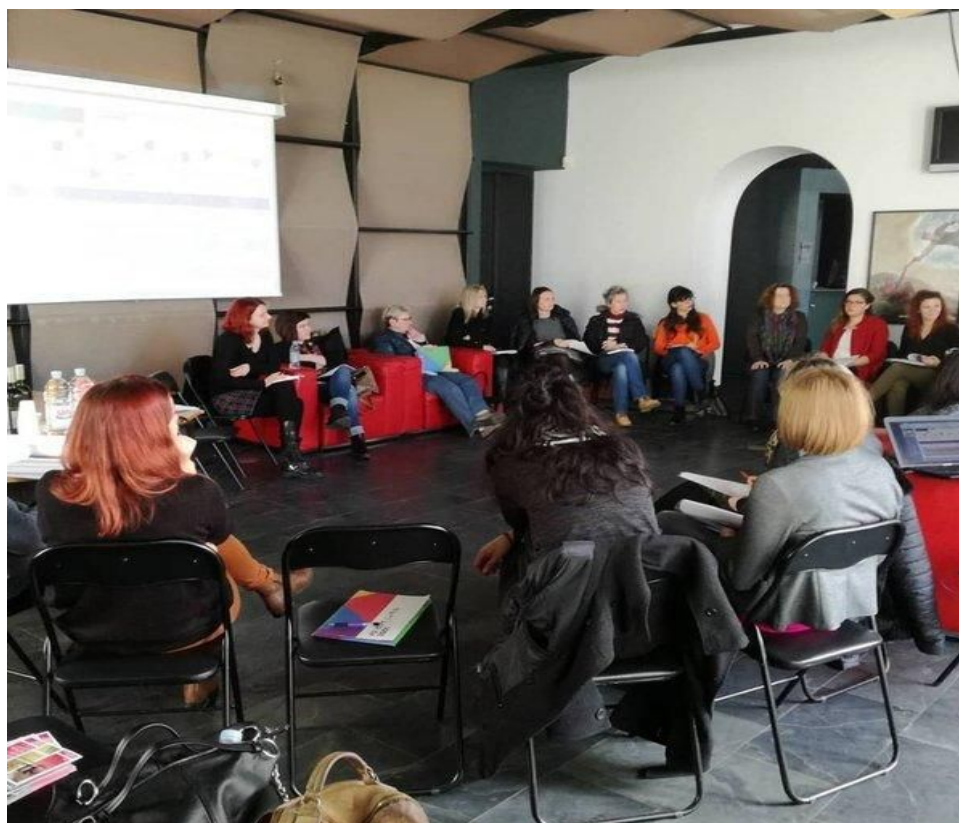
Fotografija 9. Predstavljanje volonterskih programa udruga i ustanova, Poreč, 13.3.2018.

U 2018. godini Volonterski centar Istra pružao je mentorsku podršku suradničkim organizacijama (udrugama i javnim ustanovama) u području izrade i provedbe volonterskog programa, odnosno pripadajućeg akcijskog plana, te supervizijsku podršku predstavnicama Centra za građanske inicijative Poreč i Društva Naša djeca Poreč.