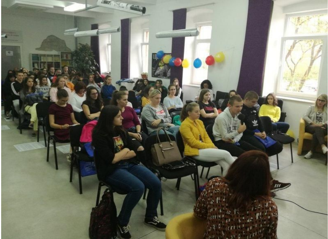
Fotografija 5. Prezentacija i rasprava "Učim. Volontiram. Putujem. Je li moguće?", Pula, 16.10.2018.