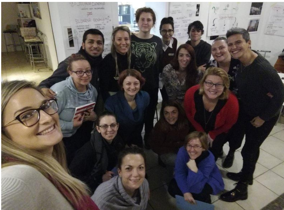
Fotografija 7. Drugi modul treninga za mentore programa PRiKAZ, projekt PYLE, Pula, 16.12.2018.

Sve aktivnosti projekta kontinuirano se promoviraju na društvenim mrežama, stranici Knowledge Exchange Base i izdavanjem biltena PYLE.