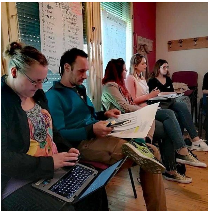
Fotografija 6. Drugi međunarodni sastanak u sklopu projekta PYLE, Skoplje, 11.-14.4.2018.

Projekt je usmjeren na izradu i objavljivanje informalnog kurikuluma treninga mentora/ica za provedbu programa PRiKAZ/PDCAE programa u području zapošljavanja mladih, kao i na ostvarivanje uvjeta za provedbu treninga mentora/ica mladih nezaposlenih osoba u zemljama partnerskih organizacija. Projekt je započeo s provedbom 1.9.2017. godine, a u 2018. godini ostvareni su značajni rezultati.