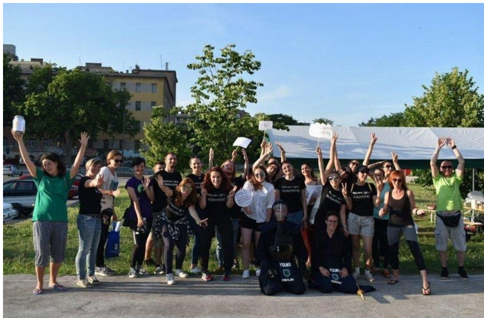
Fotografija 4. Volonterska akcija “Sportski dan za udrugu Institut”, Pula, 26.5.2018.

Osim volonterskih akcija, članovi/ice Kluba mladih volontera organizirali su dvije aktivnosti s ciljem unaprjeđenja kvalitete provođenja slobodnog vremena kod mladih, osiguravajući raznovrsnost sadržaja. Tako je održana “Večer poezije” te predavanje “Mitovi o prehrani” uz podršku Savjetovališta za prehranu Savjetovališta za javno zdravstvo Istarske županije.