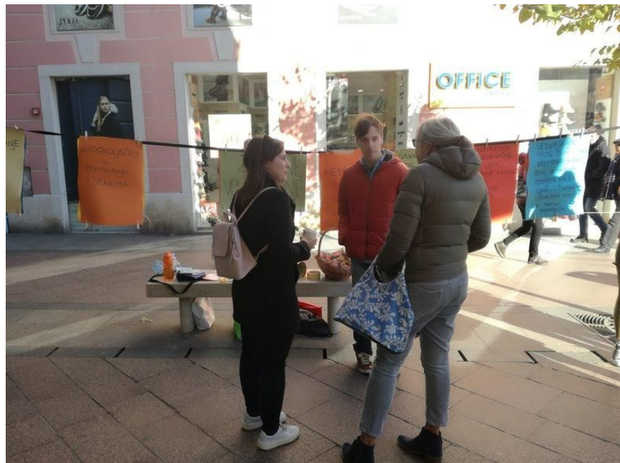
Fotografija 1. Obilježavanje Međunarodnog dana volontera, Pula, 5.12.2018.

U navedenom razdoblju provedene su informativno-motivacijske radionice o volontiranju za mlade, učenike/ce osnovnih i srednjih škola, kao i aktivnosti pružanja tehničke i stručne podrške te promocije organizatora volontiranja građanima/kama, odnosno potencijalnim volonterima/kama. Obilježavanjem Međunarodnog dana volontera, organizacijom i provedbom volonterske akcije pod nazivom “Za mene, volontiranje je...” kroz interakciju s volonterima/kama više od 100 građana/ki informirano je o vrijednostima volontiranja te mogućnostima volontiranja u zajednici.